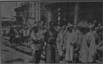
Un rebelde al ser presentado al Tribunal, antes de su ejecución

En China, no se andan por las ramas para castigar á los rebeldes al régimen gubernamental que tiene la mala suerte de ser aprehendido por las autoridades ya puede contarse muerto. Y no muerto así como así, sino después de haber pasado por zoológicos suplicios y muy duros tormentos, propinados ante enorme-masa