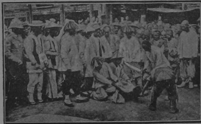
Decapitación de un revolucionario en una plaza pública

de público á la que se congrega para que la visión de los castigos inferidos al culpable ejerza en la multitud influencia ejemplar. Este sistema de ejecución de las penas se halla tan infiltrado en el país que no bastan á exterminarlo los progresos de la civilización.